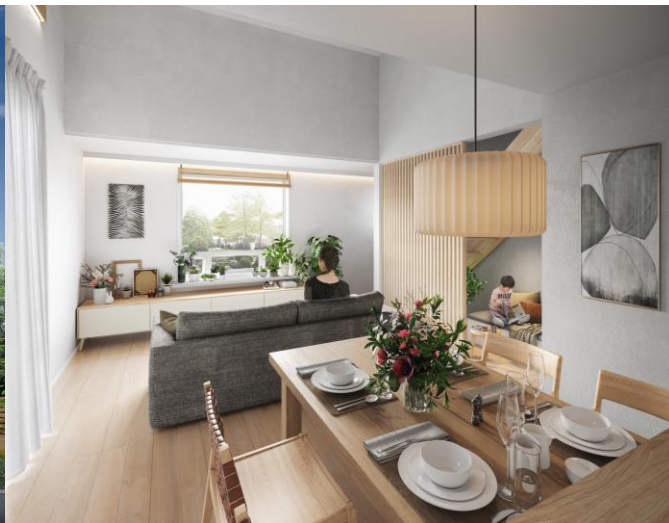
プロトタイプ 内観パース