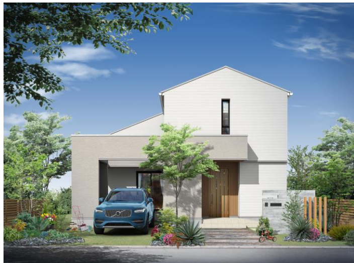
プロトタイプ 外観パース